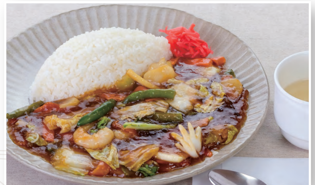
五目あんかけご飯<スープ付> 1,000円 (税込)