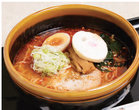
辛みそラーメン 900円 (税込)