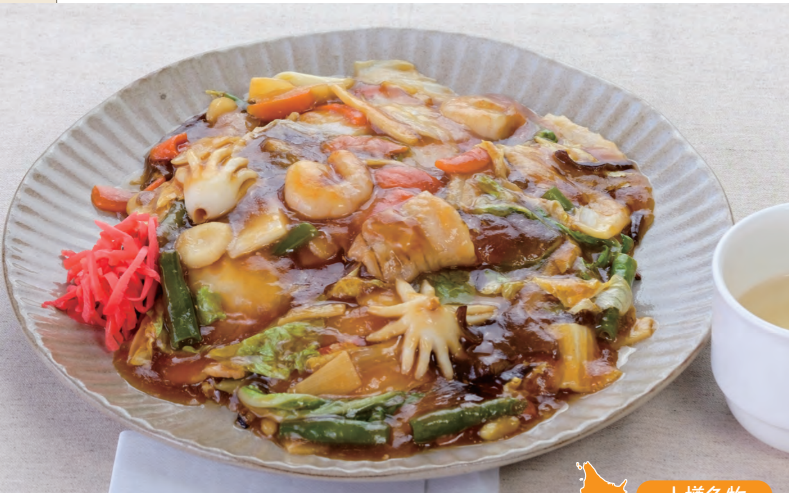
五目あんかけ焼きそば<スープ付> 1,100円 (税込)