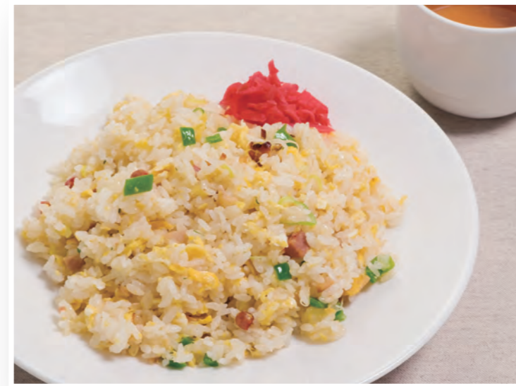
五目チャーハン <スープ付>

道内各地の人気メニューをここに集めての “味めぐり” 美味しいひと時をお過ごしください。