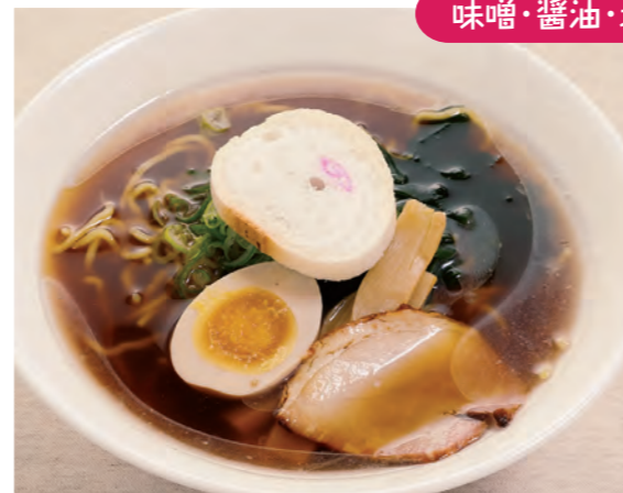
ラーメン各種 850円 (税込)